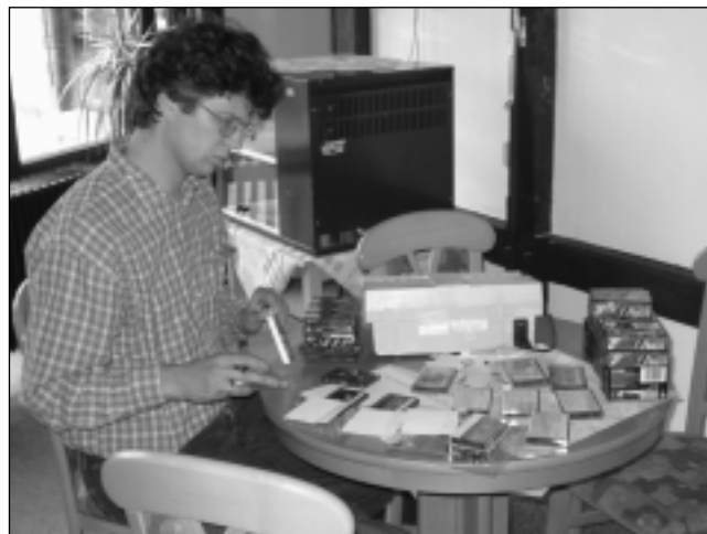
Die Kassettenaufnahmen der TLF-Referate waren stark nachgefragt