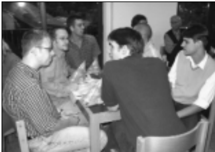
Die MV-Pastorenanwärter miteinander im Gespräch

Frauen in Lehr-, Verkündigungs- und Leitungstätigkeiten und Beauftragungen gibt es zuhauf, sowohl in der Ortsgemeinde, als auch in der Mission(!) und in verschiedensten Gremien und